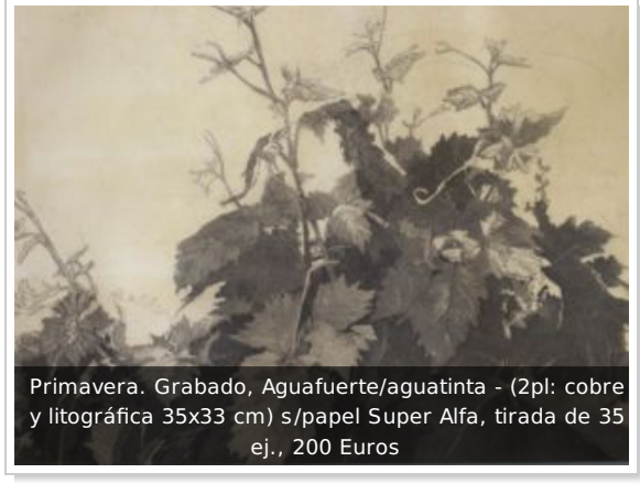
Primavera. Grabado, Aguafuerte/aguatinta - (2pl: cobre y litográfica 35x33 cm) s/papel Super Alfa, tirada de 35 ej., 200 Euros